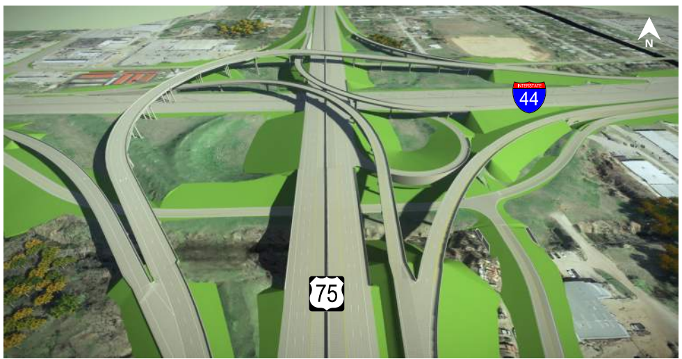
Giao lộ I-44/US-75 Có thể xây dựng trong Tương lai