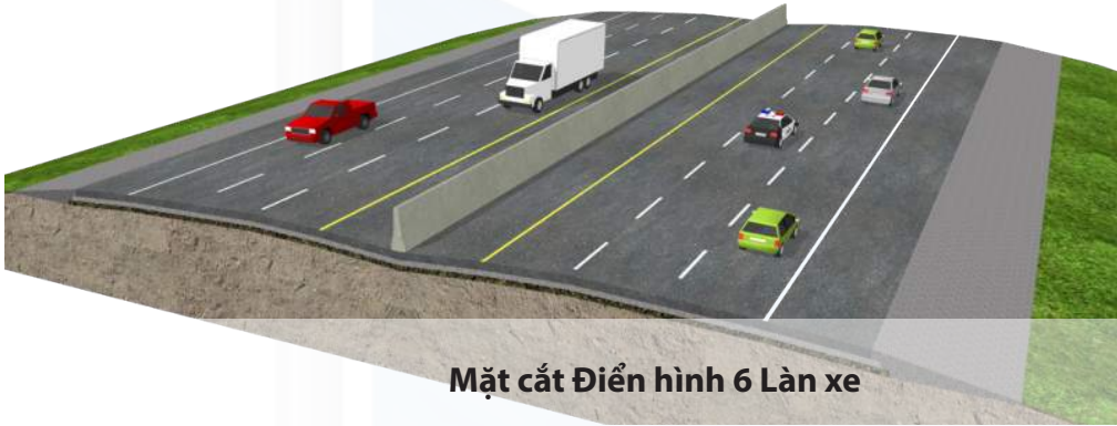
Mặt cắt Điển hình 6 Làn xe